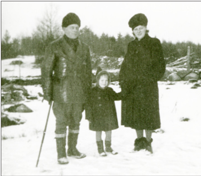
Jag med fosterföräldrar "på hal is"