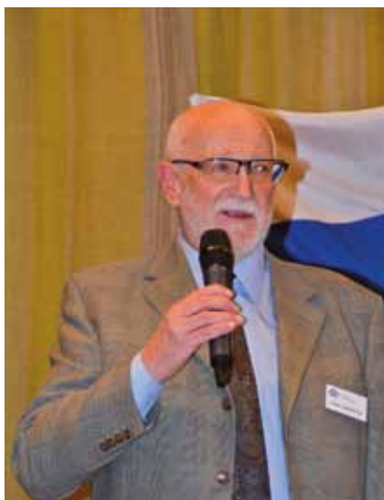
Soini berättar om boken

TERVE medlemsblad för Sydsveriges Finska Krigsbarn.