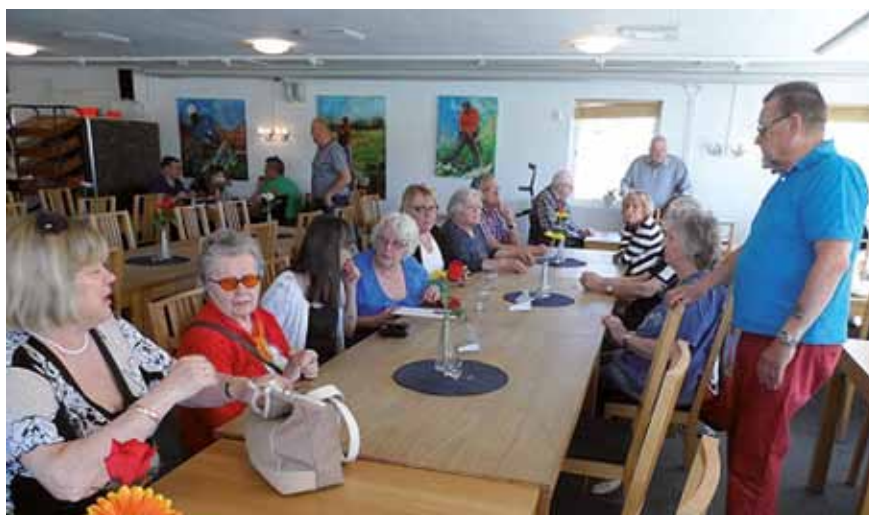
Mötesdeltagarna börjar samlas i Lövet's matsal.