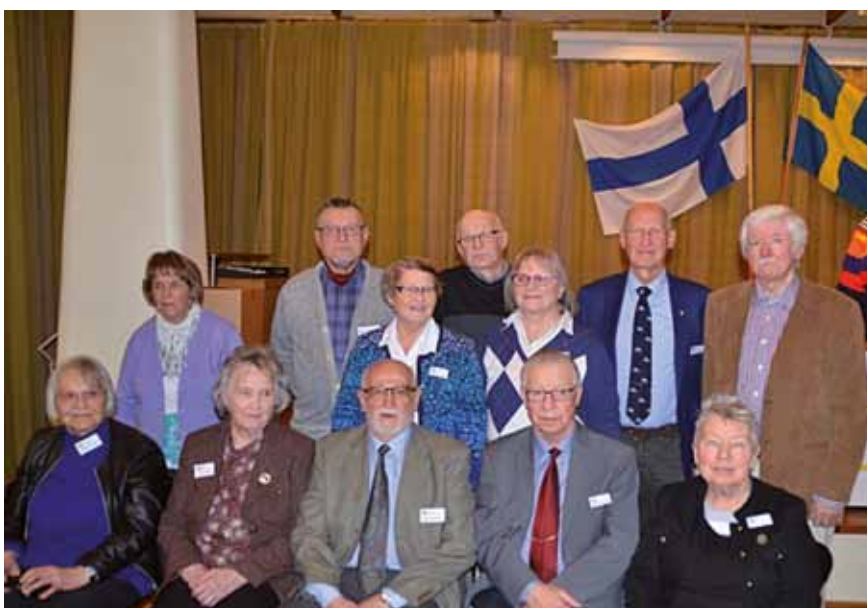
De närvarande som skrivit sin berättelse i boken samlade efter Boksläppet.