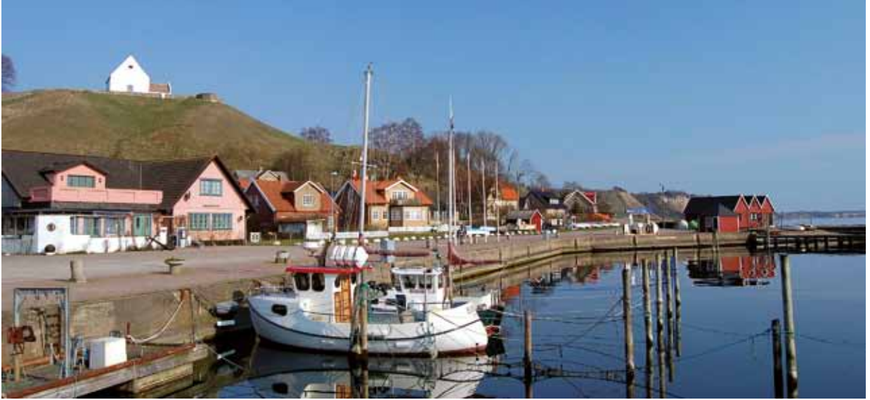
Kyrkbacken och Sankt Ibbs kyrka