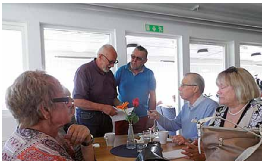
Försäljning av Krigsbarnsminnesboken pågår för fullt.